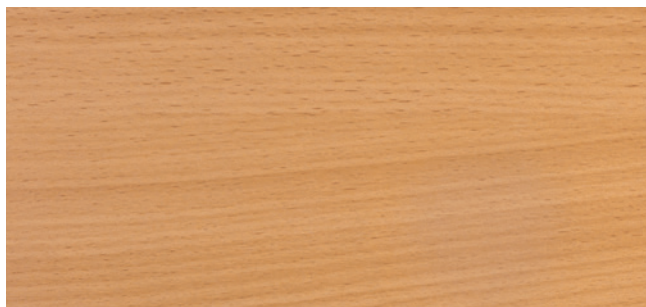
MLHE Unilin Jura - 747