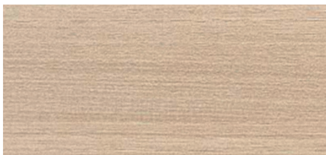
ML91 (≈HP91) Egger Lakeland Akazie Hell - H1277 ST9