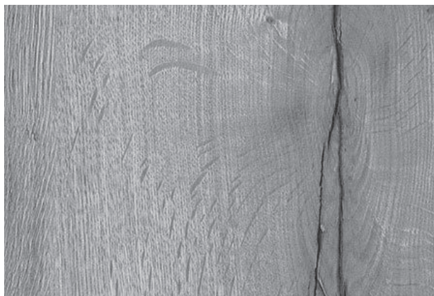
Detailed view (approx. 27 x 18 cm)