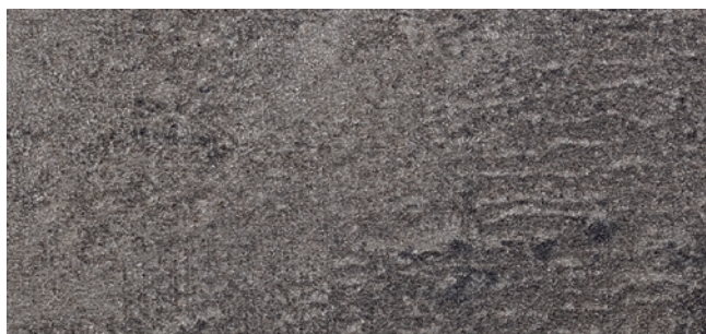
ML02 (≈HP02) Egger Beton Dunkel - F275 ST9