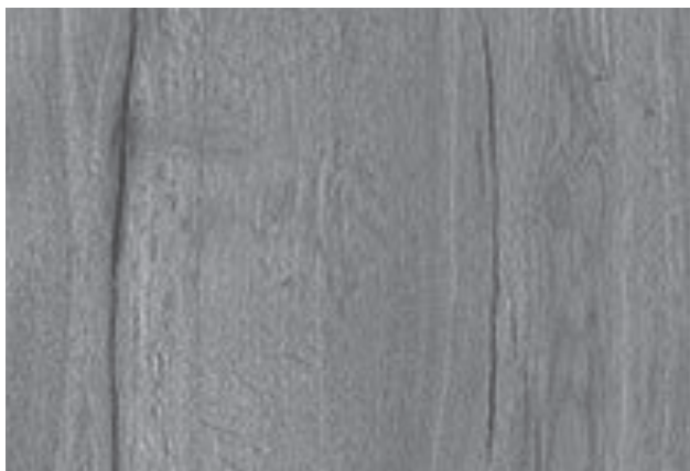
Close up view (approx. 60 x 37 cm)