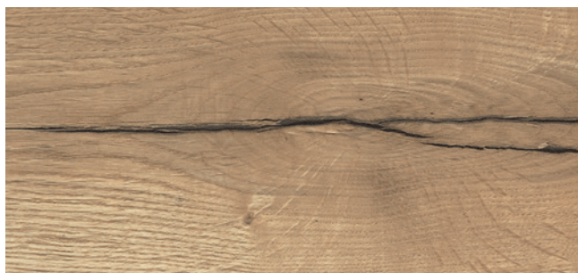
MH84 (≈HA84) Egger H1180 Halifax Eiche natur