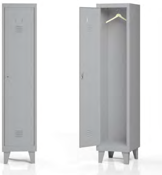
TAK300-1M1P met gelaste pootjes en standaard slot