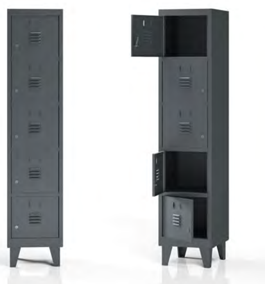
TAK400-1M5P met gelaste pootjes en standaard sloten